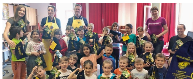
Ein Zeichen gegen Diabetes und für gesunde Ernährung. 2.800 Erstklässler erhielten das Lions „Pause“-säckchen.